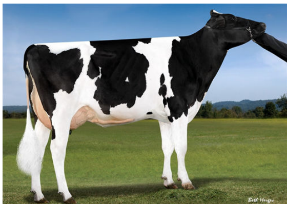
BOMAZ SILVER 6777 GRANDDAM